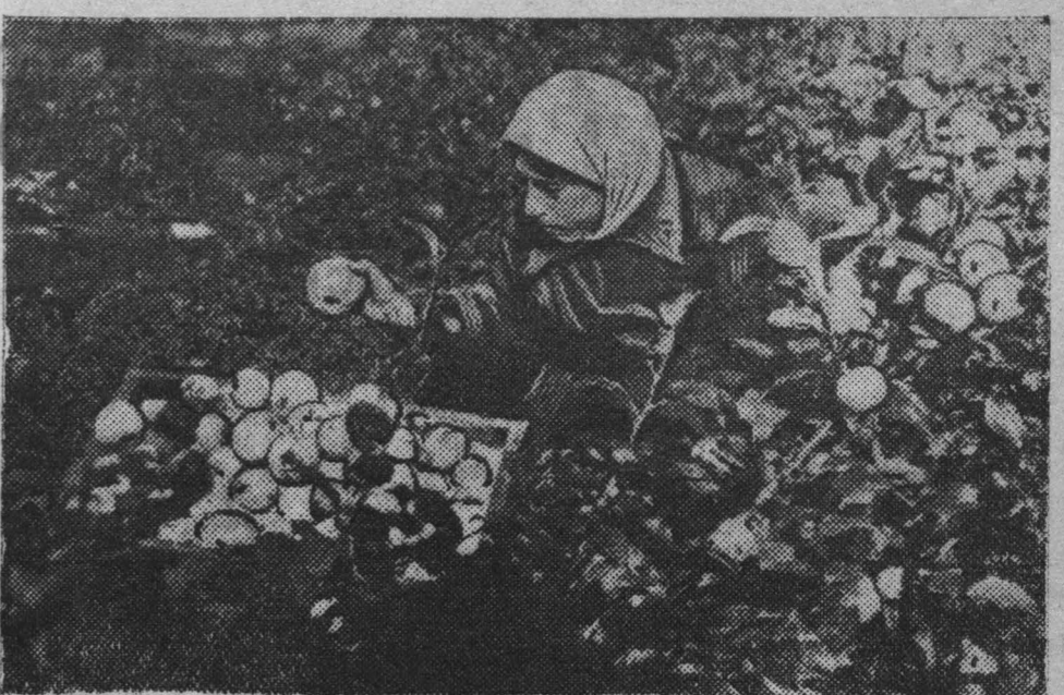
Накляные «Недели сада». В садах области началась уборка плодов, идет подготовка к новым посадкам. На снимке: Служащая яблоня в саду «Зеленстрой» (Кемерово).

ГААГА, 16 сентября. (ТАСС). Газеты, ссылаясь на сообщения из Джакарты (Батавия), пишут, что голландские власти объявили вне закона деятельность коммунистической партии на территории Индонезии, захваченной голландскими войсками. Согласно сообщением, голландцы будут применять суровые меры против всякой деятельности коммунистов.