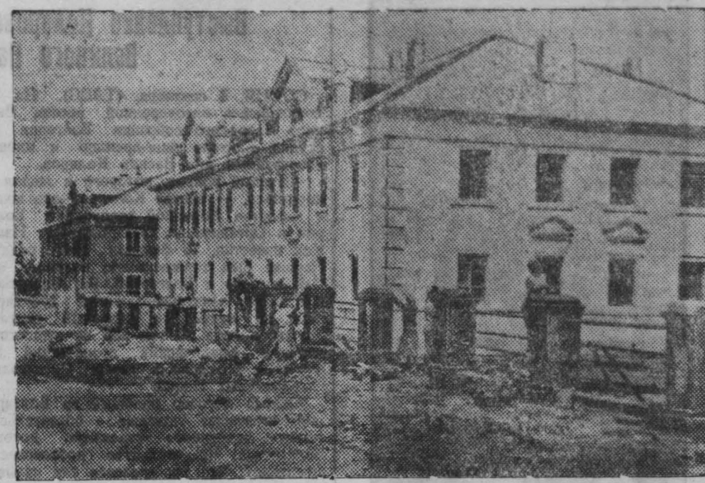
Строительство рабочего поселка Ясная Поляна для горняков шахты имени Сталина (Прокопьевск).

Резервы экономии, снижения себестоимости продукции на предприятиях неисчерпаемы.