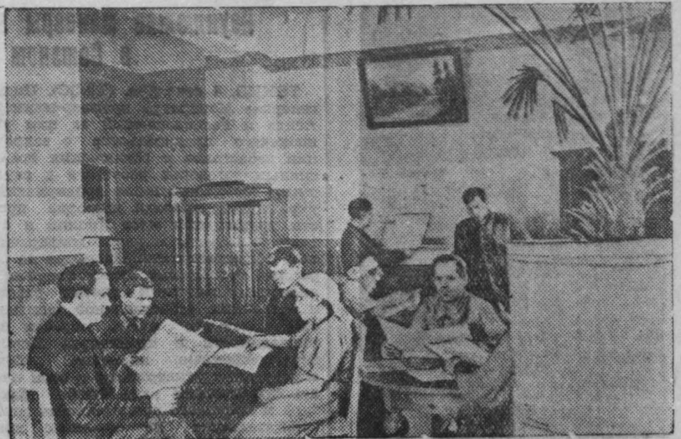
В читальном зале библиотеки шахты им. Сталина (Прокопьевск).