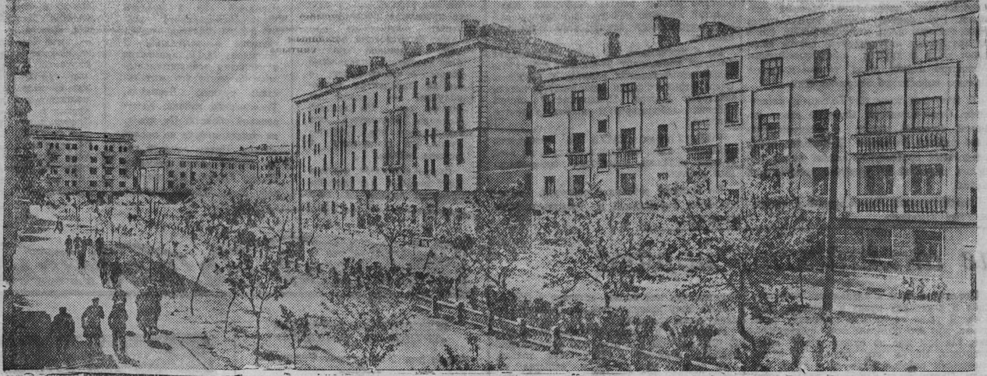
Кемерово сегодня. Улица Н. Островского.

Иду я по городу в свете огней... Луна в ясном небе, асфальт под ногами. И плещется рядом прибор тополей, Густою листвою над клубом с цветами. Высокие здания, простор площадей Я вижу — повсюду меня окружили. Сверкают полосы трамвайных путей Вдоль буйных садов, что мы сами Взрастили. Стоят величаво громады цехов, Дымят пароходы над шумной волною. И грохот груженых углем поездов Не молкнет в горах и в бору за рекою. Мой город, столица Кузнецкой земли, Горжусь я, как сын, твоей силой Могучей. Простыми людьми, что тебя возвели На месте, где был луга, пустыри До берег в осине под ивой плещучей В труде и в бою твой народ закален, Тобою гордится родная Отчина. Под заревом славных советских знамен Мы смело шагаем в простор коммунизма!