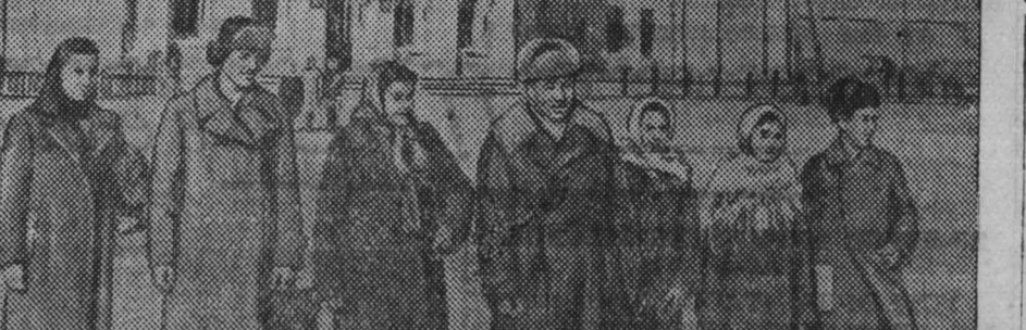
В Бурят-Монголии на месте, где была голая степь, за годы советской власти вырос благоустроенный рабочий поселок Гусиное Озеро.