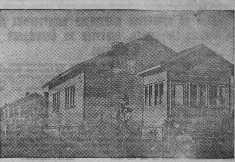
С каждым днем шире развертывается жилищное строительство для горняков Кузбасса. На снимке: вновь выстроенные жилые дома для шахтеров треста «Беловоуголь».

КОЛХОЗНИКИ АКТИВНО УЧАСТВУЮТ В ДОРОЖНЫХ РАБОТАХ Мариинский район включился в областной месячник дорожного строительства. Колхозники активно участвуют в дорожных работах. В прошлом двухнедельнике в них участвовало около двух тысяч человек. Колхозы и районные организации выделили 500 конных подвод и 30 автомашины. Только за три дня — с 15 по 18 июня — подвезено сто кубометров гравия, восстановлено сто погонных метров искусственных сооружений, капитально отремонтировано два километра дорог, а на 18 километрах дорог сделан текущий ремонт. Мариинские колхозники, включившись в месячник, решили до начала хлебозаставки привести в порядок все свои дороги. П. Герасимов.