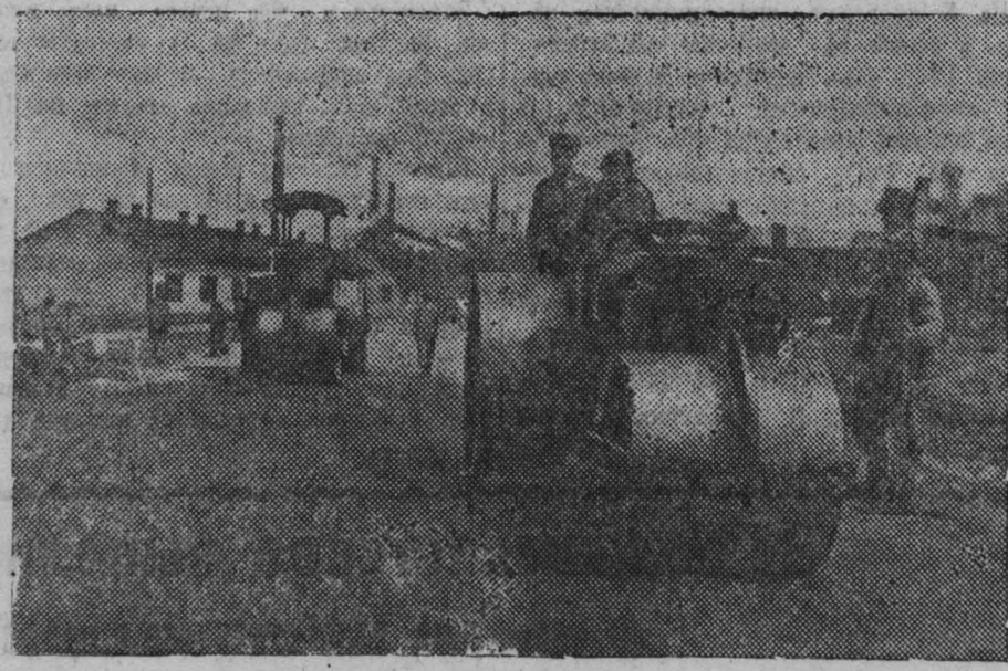
Работы по благоустройству в г. Кемерово. На снимке: асфальтирование одной из улиц в Заводском районе.

Чем дальше мы идем вперед, тем больше нашей великой конечной целью, тем больше усилий нужно приложить для коммунистического воспитания людей, искоренения из них сознания пережитков капитализма. Огромные задачи дальнейшего подсема экономического могущества Советского Союза требуют от каждого нашего человека высокоосознательного отношения к своим обязанностям, новых усилий к повышению производительности труда. Советский человек силен тем, что он знает, куда идет и зачем идет. Он силен своей идельной истрадой, великими коммунистическими идеалами. Б. ЛЕВИН.