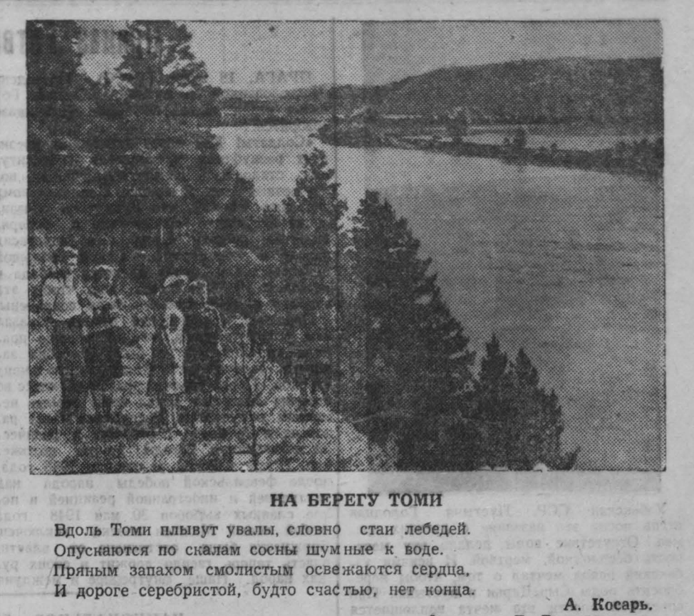
НА БЕРЕГУ ТОМИ

Помимо внутренней забойки шпура, обязательно делается внешняя забойка из инертной пыли. Инертная пыль насыпается на деревянные лопаточки, которые узким концом вставлены в устье шпура. Количество инертной пыли для забойки должно составлять 1,5 килограмма на 200 граммов заряда, не менее 1,5 килограмма на шпур. Кроме того обязательно производится ослепление (осыпание) инертной пылью груди забоя, а в подготовительных выработках стен на протяжении 20 метров от забоя.