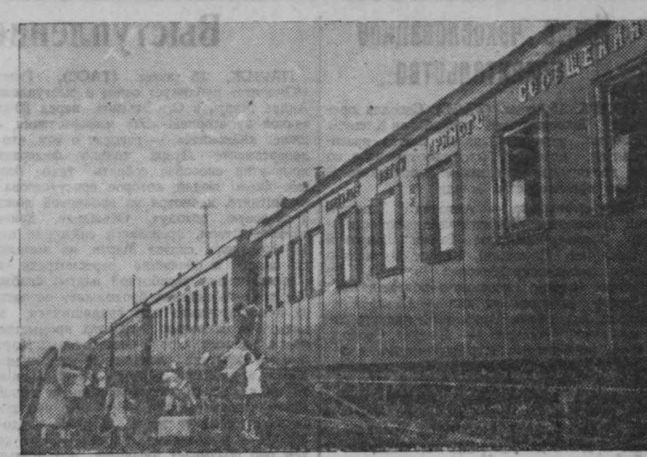
С мая текущего года между Москвой и Кемерово курсирует специальный поезд прямого сообщения. На снимке: прибытие поезда в Кемерово.

Под таким заголовком 22 мая была опубликована корреспонденция райдвой бригады газеты «Кузбасс». Проктопьевский горисполком сообщил, что корреспонденция обещалась на совещании работников промышленности и инва. лидной кооперации города. Факты признаны правильными. Совещание наметило конкретные мероприятия по увеличению выпуска товаров широкого потребления. В настоящее время артель «Третья пятилетка» изготавливает и продает колесную мазь, налаживается выпуск спонжового крема, оборудуется цех для производства соды. В июне поступит в продажу извест, смола, деготь, скипидар. Артелью «Прогресс» возобновляется производство шеток и кистей, швейные и обувные артели организуют ряд ремонтных мастерских на окраинах города.