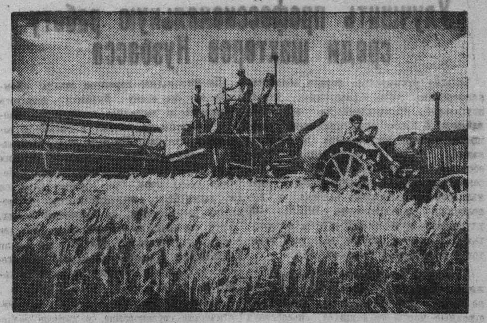
Туркменская ССР. В Ашхабадской и Марынской областях развернулась массовая уборка ячменя. На уборку обильного урожая вышли комбайны.