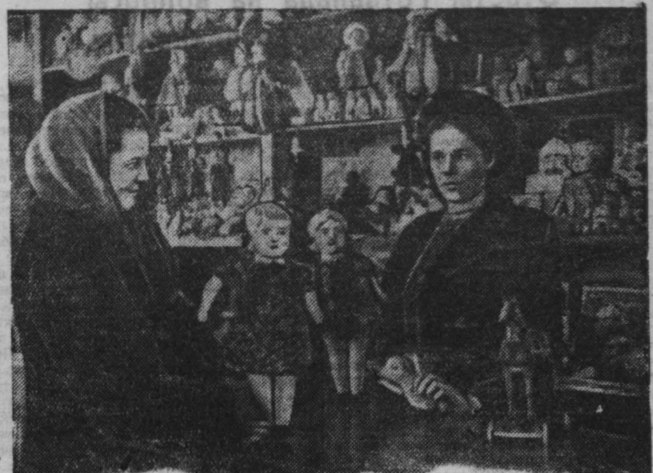
В кемеровском магазине «Роскульттор» — большой выбор детской игрушки.