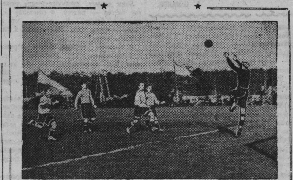
На стадионе «Угольщик» Кемеровского рудника. Встреча команд «Химик» (Кемерово) и «Держинец» (Челябинск).

Со счетом 4:0 в пользу «Химика» заканчивается матч.