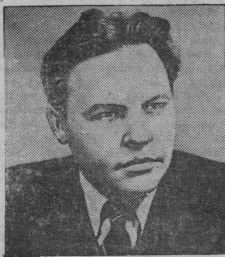
Н. А. Вознесенский.