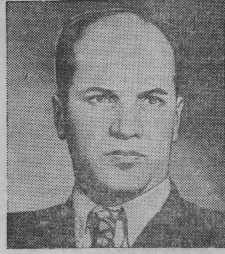
А. А. Илюшин