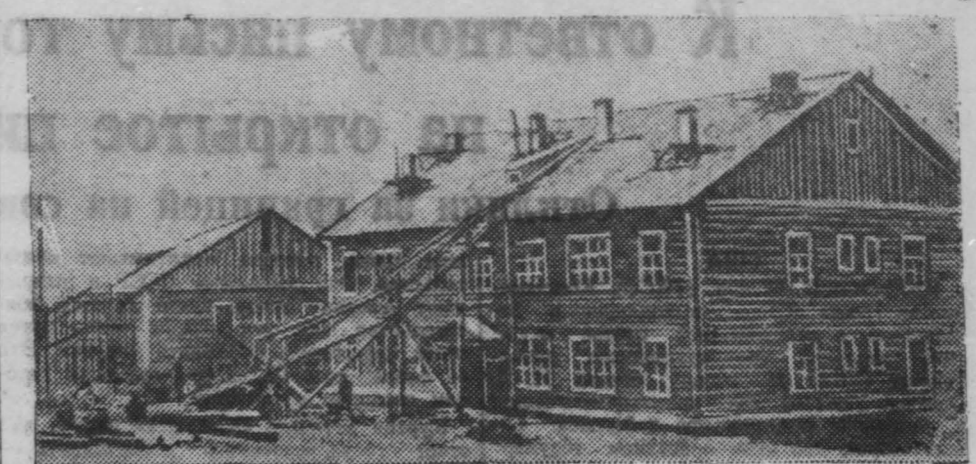
На шахте «Капитальная» треста «Молотовуголь» заканчиваются строительством два 8-квартирных дома для горняков. На снимке: на стройке 8-квартирных домов.