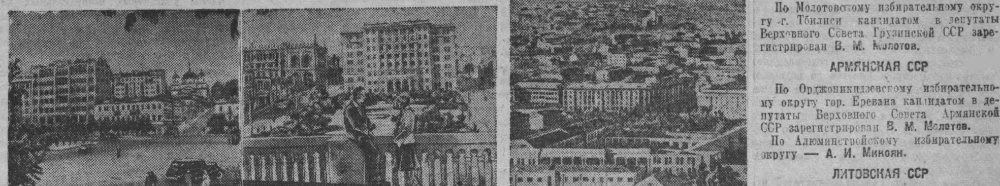
По городам Советского Союза. На снимках (слева направо): 1. Столица Украины — город Киев. Центральная площадь площади имени Независимости. 2. Актинский парк Азербайджанской ССР. 3. Город Ереван. Общий вид города. 4. Вали видна гора Арабат.

По Львовскому—Сталинскому избирательному округу — Н. М. Шверник, По Львовскому—Сталинскому избирательному округу — Н. М. Шверник.