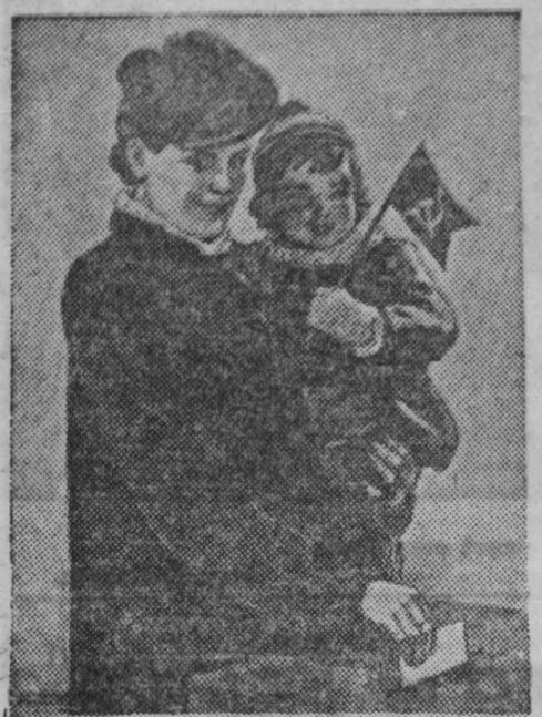
Плкат работы художника В. Корепкова, вышедший издательством «Искусство».