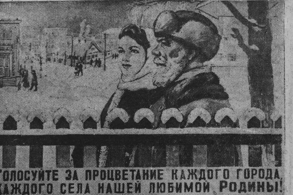
Плакаты работы художника Г. Шубиной, выпущенный издательством «Искусство» ко дню выборов в местные Советы депутатов трудящихся.

Следующее заседание рабочего комитета состоится в январе.