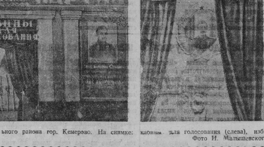
Кандидаты в депутаты (слева), избирательные урны (справа).