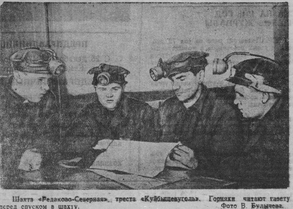
Шахта «Редково-Северная» треста «Куйбышевуголь». Горняки читают газету перед спуском в шахту.

Служа примеру ленинградцев, рудобойцы Орабаша выкатились в соревнование за выполнение пятилетки в четыре года. Сейчас они досрочно завершают годовую план добычи угля».