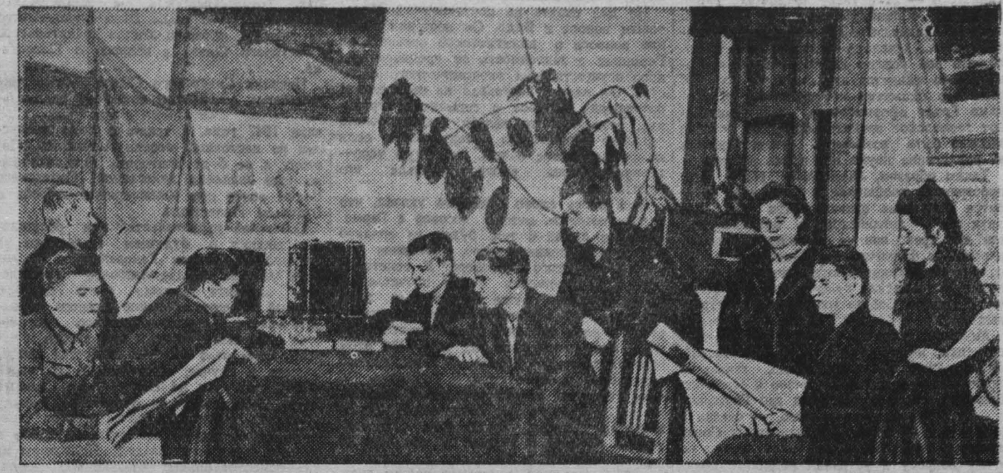
В красном уголке образцового общежития шахты имени Сталина (Прокопьевск).