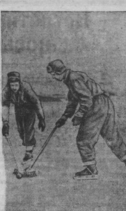
На Кемеровском сталкин «азот».

Лучшие мастера лыжного спорта, показавшие на областных соревнованиях самые хорошие результаты, в составе 12 человек, 2 февраля выезжают в Ленинград на Всесоюзные соревнования добровольного спортивного общества трудовых резервов. Команде Кемеровской области предстоит на этих соревнованиях защищать честь Кузбасса. Всесоюзные лыжные соревнования состоятся с 12 по 18 февраля сего года.