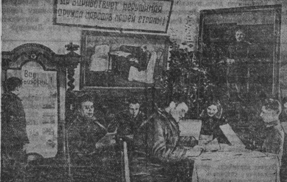
325-й Сталинский—городской избирательный округ. Хорошо оборудован агитпункт 57-го избирательного участка (клуб им. Дзержинского). Здесь много литературы, наглядных пособий. Избиратели охотно осматривают оной агитпункт.

В Верхнем Кузнецком районе комхозы в основном выполнили план засыпки семян. Плодоотдача уроки ничему не научили кузнецких комхозов.