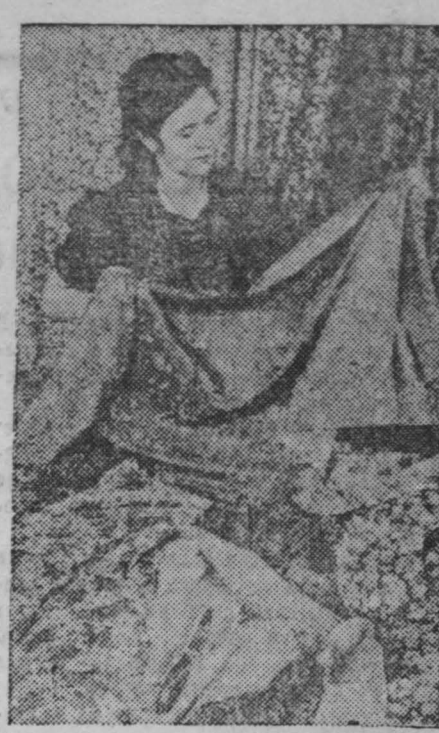
Иваново Коллектив отделочной фабрики Нало-Ивановской мануфактуры готовит к 30-й годовщине Октября подарок — 600 тысяч метров ткани сверх годового плана.

В таких беседах проточит изучение избирательного закона Протые и глубоко правдивые воспоминания пожилых избирателей помогают агитатору в их работе. Ярко подчеркивают те огромные изменения, какие внесла советская власть в жизнь трудящихся нашей страны.