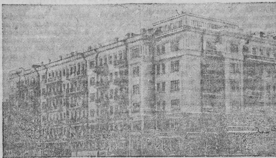
Сталинск. Дом № 20 на центральной магистрали города — проспекте имени Молотова.

производственного успеха. От сотни поросенков ему овецматок, он получил 138 ягнят.