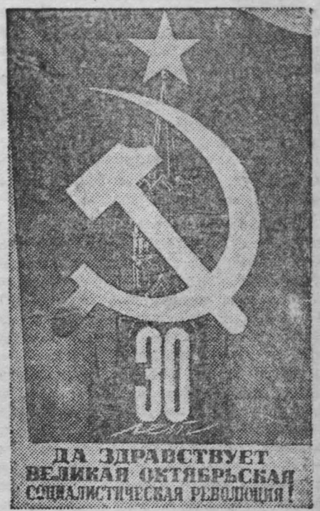
Плакаты работы художника В. Викторовой, опубликованный издательством «Искусство».