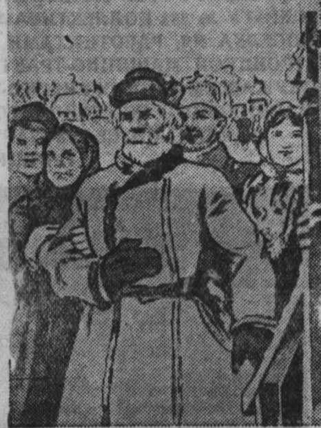
Плакат, выпущенный издательством «Искусство». Рисунок художника М. Соколовского. (Фотохроника ТАСС).