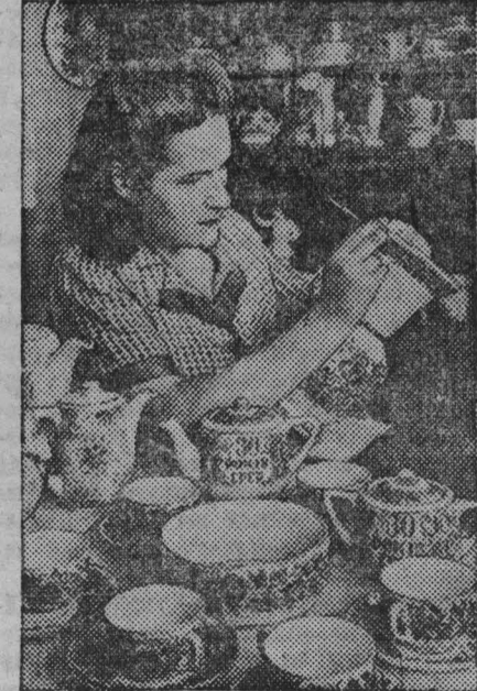
Киев. Фарфоро-фаянсовый завод «Керамик» к 30-й годовщине Октября выпускает художественно исполненные столовые и чайные сервизы.

Готовится обширный иллюстрированный каталог выставки. (ТАСС.)