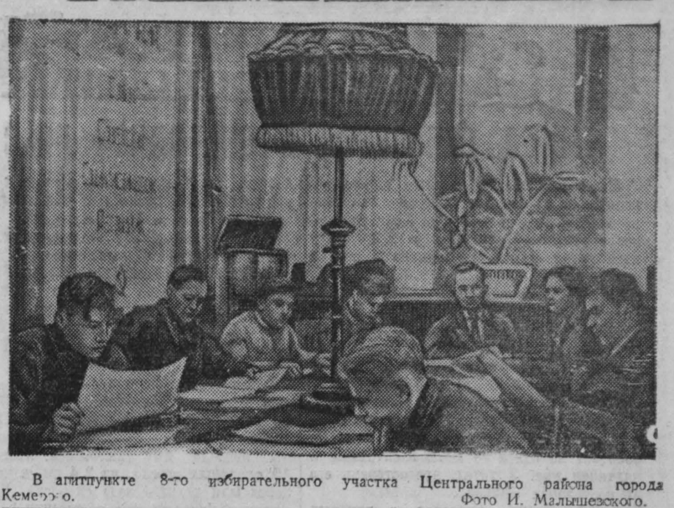
В агитпункте 8-го избирательного участка Центрального района города Кемерово.

продолжают ПРИЕМ на 3 очные обучения СТЕНОГРАФИИ зачисление производится в течение всего года. Подробный проспект высылается по получении 2 руб. почтовым переводом. Новый адрес курсов: Москва, 51-Б, Карегный переулок, 10/А