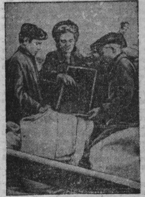
Активную помощь комсомольцы и молодежь гор. Кемерово оказывают колхозам в деле хлебопоставок государству. На снимке: учащиеся ремесленного училища № 15 во время выгрузки зерна из баржи.

Нет никаких причин для отставания и у колхозов «Советская Сибирь», который сдал государству за август только два центнера зерна из плана 500, имени Стаханова, сданного 280 центнеров из плана 563, «Авангард», вывезшего на