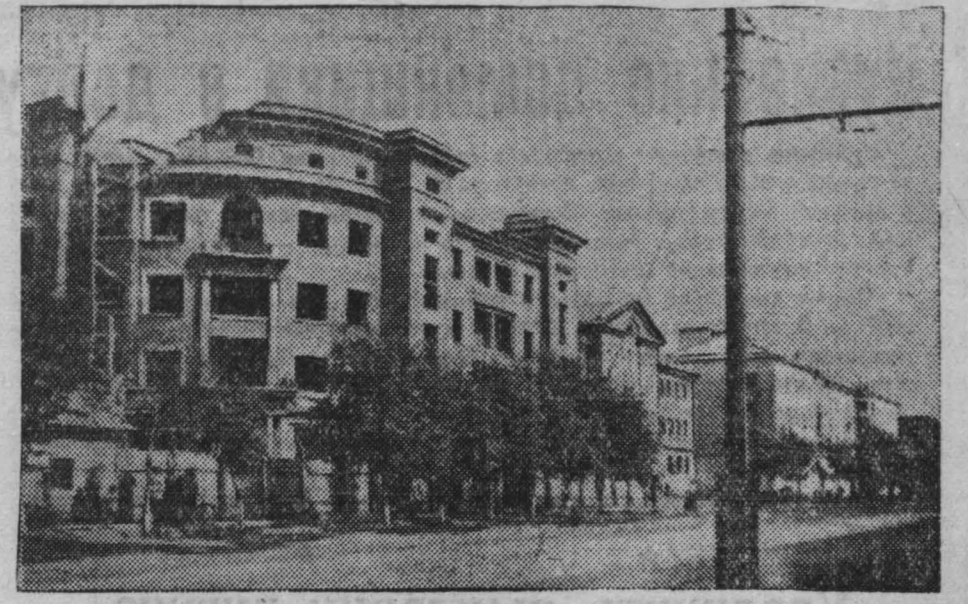
Кемерово. Строительство жилого дома по Советской улице.

Купации Германии существует серьезная опасность для свободы демократической печати и вообще для демократического переустройства немецкого народа.