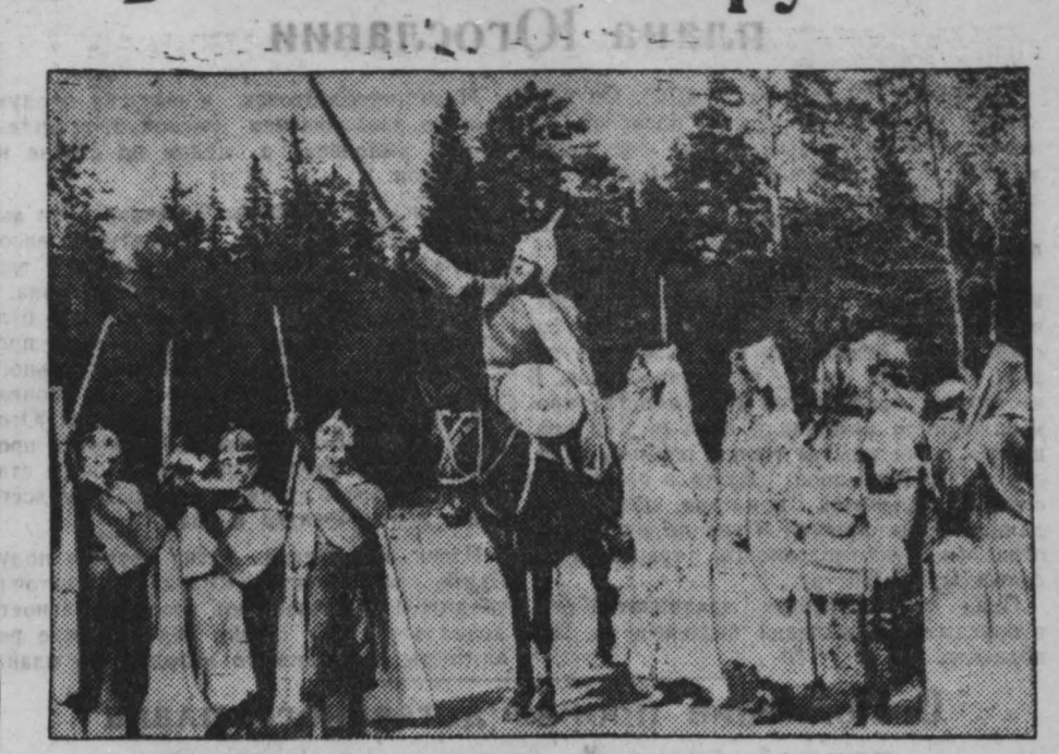
Отряды расходятся по павильонам. Но вдруг между молодым ельником, что окружает павильоны, то здесь, то там начинают появляться феи и бабочки. Начинается парад масок.

Девочка в белом олеянии. На голове у нее позолоченная корона с золотой звездочкой «Девятое мая». Всем известная дата. Ее окружает свита «своих» — летчики, танкисты, стрелки. И сотни ребят кричат: «Победа, Победа!».