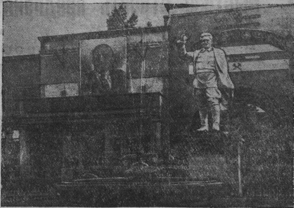
Шахта имени Кирова треста «Леншуголь». Главный вход в шахтоуправление.

В Хуайяни находится один из крупнейших концентрационных лагерей, в котором содержится 500 заключенных. Заключенные, закованные в ручные и ножные кандалы, подвергаются всевозможным пыткам. Концентрационный лагерь в Ляньюше расположен в темном и сыром помещении, сильно охраняемом гоминдановскими солдатами. В Фунине имеются два «справочных центра» и пять концентрационных лагерей. За последние 13 дней застрелено 54 заключенных.