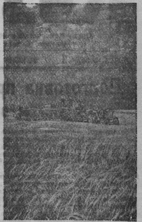
Узбекская ССР. Уборка зерновых в колхозе «Олдаш-ака», Кашка-Дарьинской области.

Время уходит. Пора тов. Гаврилову проявить заботу о будущем урожае.