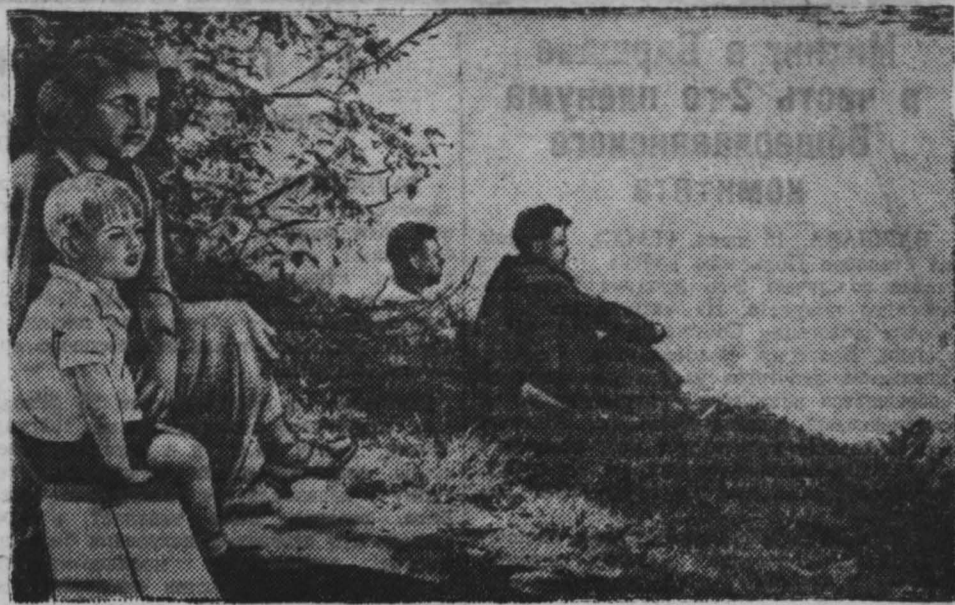
В Кемеровском городском саду.

новцы, хозяйственные и партийные руководители шахты «Журилка-3» треста «Ленинуголь». С целью быстрой подготовки квалифицированных кадров проходчиков они организовали стахановские школы непосредственно в забоях. Для этого они выделили специальные забоя на подготовительных участках. Стахановскими школами там сейчас руководят прославленные мастера проходки. Опыт журинец дает хорошие результаты. Достаточно сказать, что в первый же месяц обучения в стахановских школах рабочие, которые до этого не держали в руках каймы, все перевыполнили производственные нормы. Шахта выполняет план подготовительных работ. Горняки шахты «Журилка-3» сделали ценный почин. Следуя примеру журинец, надо организовать стахановские школы в забоях на всех шахтах Кузбасса.