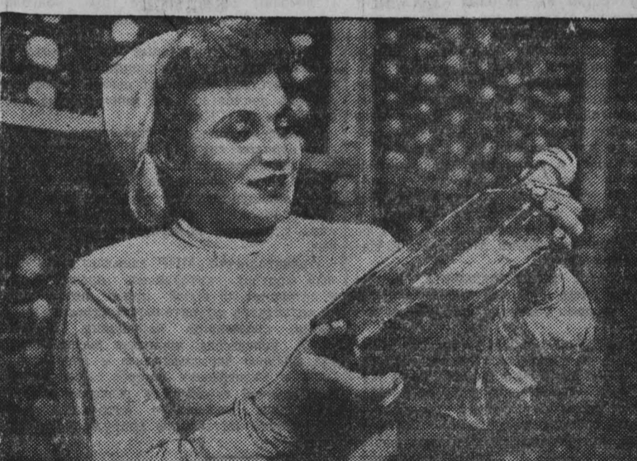
Ленинградский завод № 2 мясокомбината имени С. М. Кирова ежемесячно дает стране полтора миллиарда оксфордских единиц пенициллина.