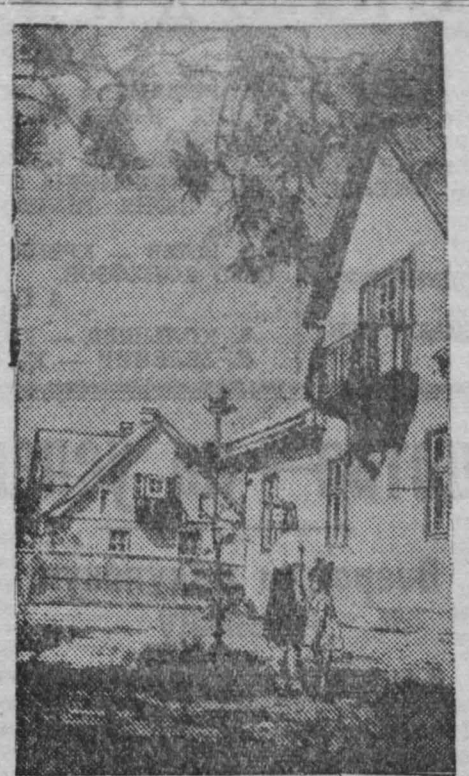
Минск. Широко развернулось строительство жилых домов в поселке Минского автомобильного завода.