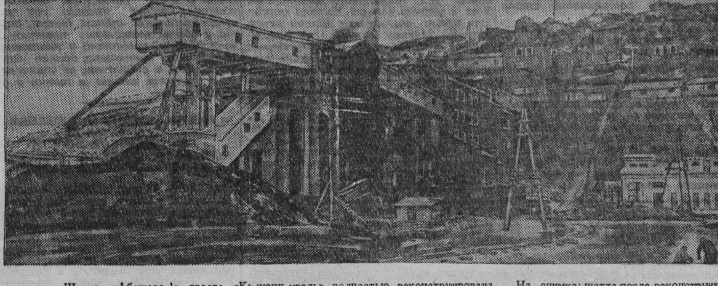
Шахта «Абашево-1» треста «Кузнецк уголь» полностью реконструирована. На снимке: шахта после реконструкции.