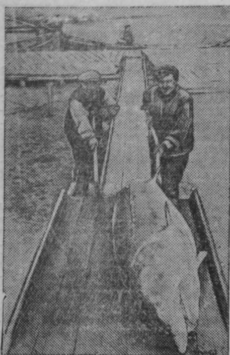
Измайльская область. Вилковские рыбаки добывают богатый улов рыбы. Рыболовский колхоз имени Тимошенко недавно выловил три белуги общим весом 600 килограммов.