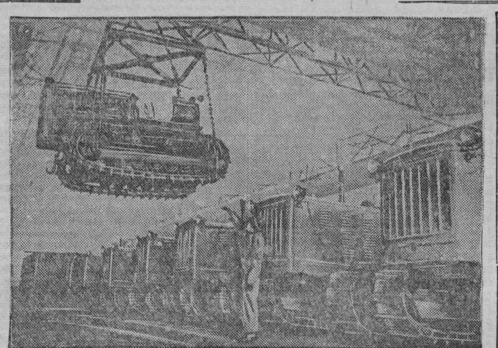
Челябинск. С конвейера Кировского завода на Урале сходят мощные гусеничные тракторы «С-80». На снимке: тракторы «С-80» перед погрузкой на железнодорожные платформы.

Сейчас на Челябинском металлургическом заводе имени Сталина начато массовое изготовление зерносушилок Григоровича. К уборочной кампании будут выпущены сотни таких зерносушилок.