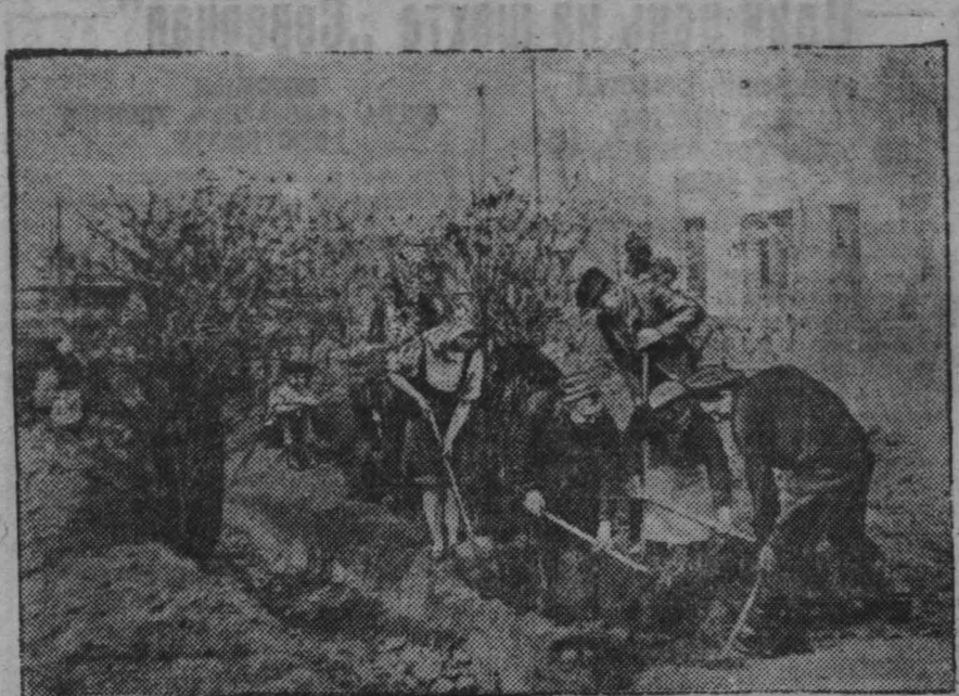
На снимке: воскресник по озеленению города Кемерово. Работы в сквере у кино-театра «Москва».