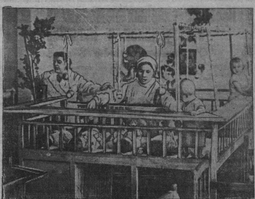
Гор. Кемерово, Детский № 7. На снимке: дети во время отдыха на занятиях.

Важнейшие средства будут вложены на расширение магнитогорского хозяйства Горной Шории. В четыре раза возрастает мощность Таштагольской электростанции.