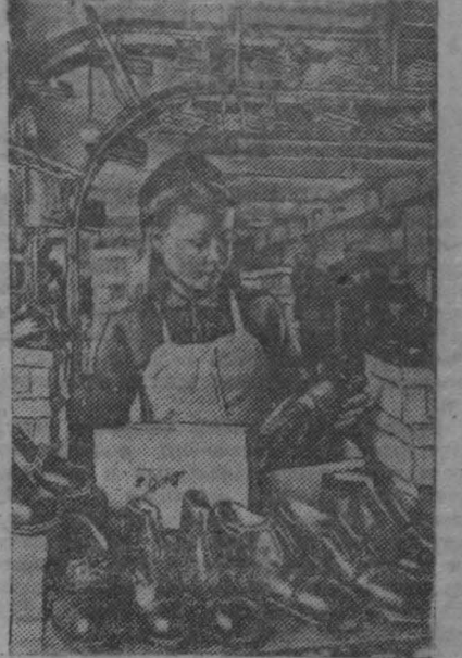
Тысячи пар изысканной мужской, дамской и детской обуви складываются ежедневно в мастерской Ленинградского ордена Ленина фабрики «Скорость».