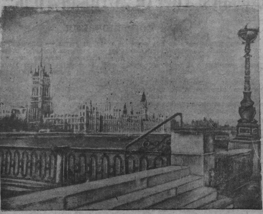
Лондон. Здание английского Парламента.

После нескольких вопросов, заданных свидетелю представителем французского обвинения, объявляется перерыв.