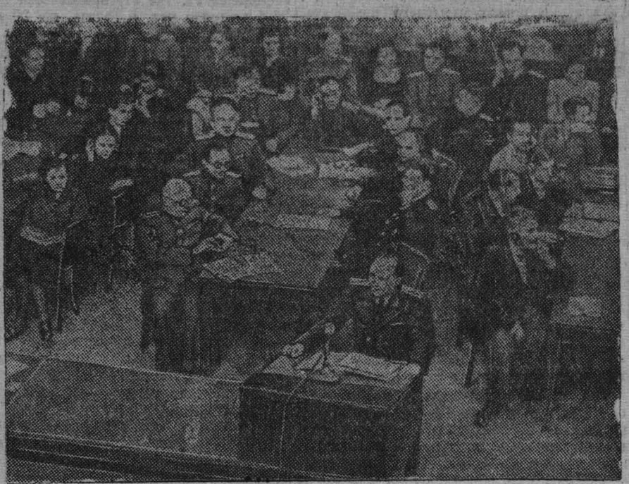
Процесс главных немецких военных преступников в Нюрнберге. На снимке: выступление бывшего обвинителя от Советского Союза тов. Руденко.

Геринг признает далее, что он знал о военных конспираторах и о том, что заключенные вынуждены работать под землей, производя снаряды «Фау-1» и «Фау-2». Он не видит в этом ничего плохого. С такой же наглостью Геринг хвастается, что он приказывал использовать военнопленных не только на подземных военных заводах, но и в земной артиллерии. Геринг восхваляет «генерал» Заукеля, обеспечивавшего германскую промышленность миллионами иностранных рабочих. Все преступления против союзных летчиков, совершенные на немецкой территории, Геринг с большой готовностью славит только на Гитлера, Гиммлера, Бормана и Геббельса. На вопрос защитника, не противоречит ли экономическая деятельность Геринга принятым Гаагской конвенции, подсудимый решительно отвечает: «Нет», но тут же добавляет, что в его словах Гаагская конвенция настолько устарела, что оценивать его деятельность с точки зрения этой конвенции было бы просто неразумно. Он считает, что вызов рабочей силы является просто частью экономической войны, которая ведется между враждующими странами. По его мнению, это — законная мера, которая должна быть предусмотрена во всех будущих конвенциях относительно правил ведения войны. На этом заканчивается вечернее заседание Трибунала.