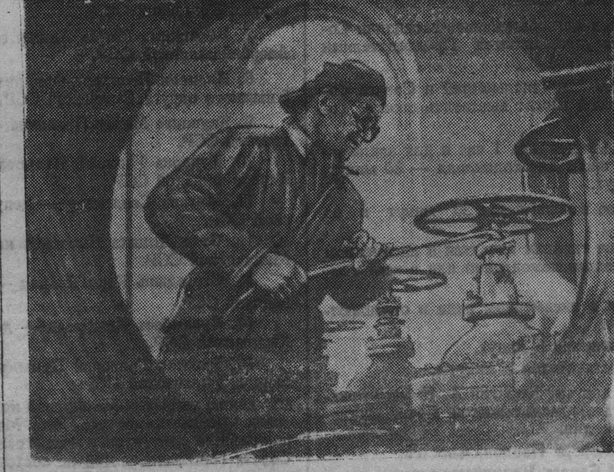
На строительстве газопровода Саратов — Москва. На снимке: последние сварочные работы на газораспределительной станции № 1.

СЧЕТНО-ДЕНЕЖНАЯ МАШИНА деленных количествах: отсчитав монету на одну заданную сумму, машина автоматически переключается для подсчета другой суммы денег. Конструкция гарантирует абсолютную точность подсчета. По размерам своим счетно-денежная машина новой конструкции (МДМ-3) не велика, ее можно установить на столе, чертяжке, табурете. Она приводится в движение небольшим электромотором или вручную. ГЕОЛОГИЧЕСКИЕ РАЗВЕДКИ В КАЗАХСТАНЕ АЛМА-АТА. (ТАСС). В Казахстане начался сезон геологических разведок. В различные местности республики выезжает 70 экспедиций. Многие партии имеют радиостанции для связи с Алма-Ата. В распоряжении разведчиков новые буровые станции, передвижные электростанции, аппаратура для новейших методов определения состава собранных образцов. Наряду с изучением известных месторождений предпринимается разведка неисследованных мест.