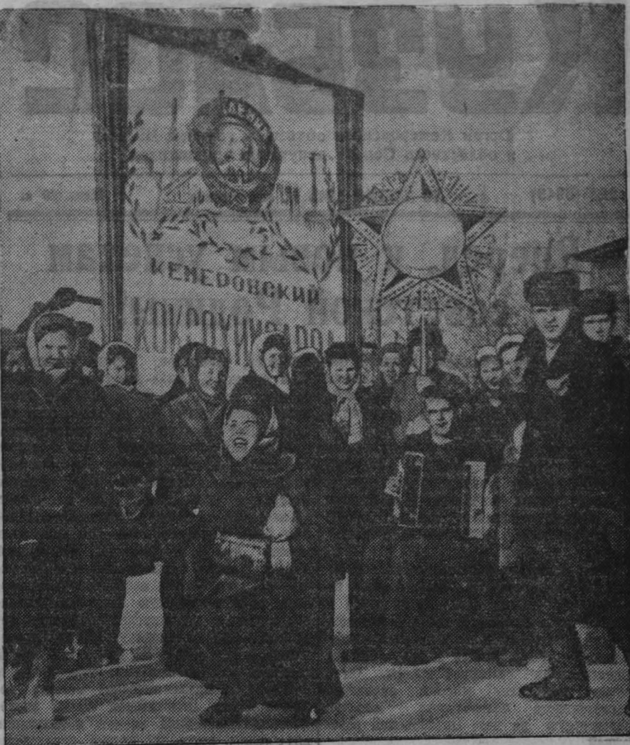
Октябрьская демонстрация в г. Кемерово.

Под знаменем Ленина, под водительством Сталина народы СССР уверенно штурмуют к полной победе коммунизма в нашей стране.