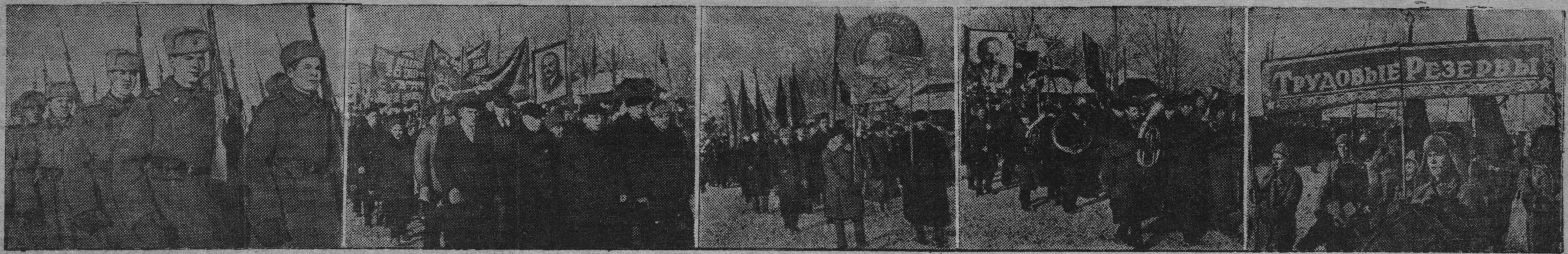
На Октябрьской демонстрации в Кемерово.