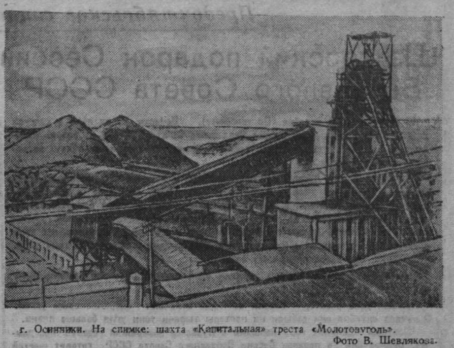
г. Осинники. На снимке: шахта «Капитальная» густа «Молотовоголь».