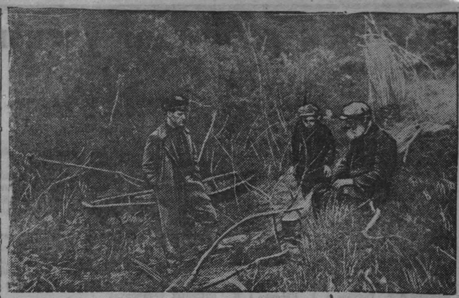
Каждую субботу, под вечер, кемеровские рыболовы уходят вдоль берега реки Томь поодаль от города, к излюбленным местам. А после богатого улова приятно посидеть у костра. Хороша уха на свежем воздухе!