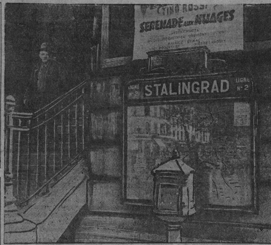
Париж. Станция метро «Сталинград».

ТЕАТР имени Луначарского — 26, 27 июня — «ЖЕНИТБА ФИГАРО»