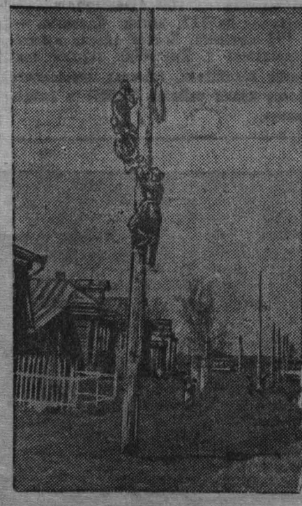
Колхоз «Знамя Октября», Владимирской области, электрифицируется. Будут освещены колхозные дома, фермы, склады. Пыль леса, молотилки и сепараторы зерна будут производиться с помощью электричества.

В Тисульском районе в прошлом году урожайность озимой ржи оказалась ниже средней урожайности зерновых. Это вызвано в значительной степени поздним поднятием паров. Земельные органы, забыв о том, что самые ценные пары — майские, вспашку паров запланировали с 5 июня по 20 июля. Но и эти запоздалые сроки земляные работники не смогли соблюсти.