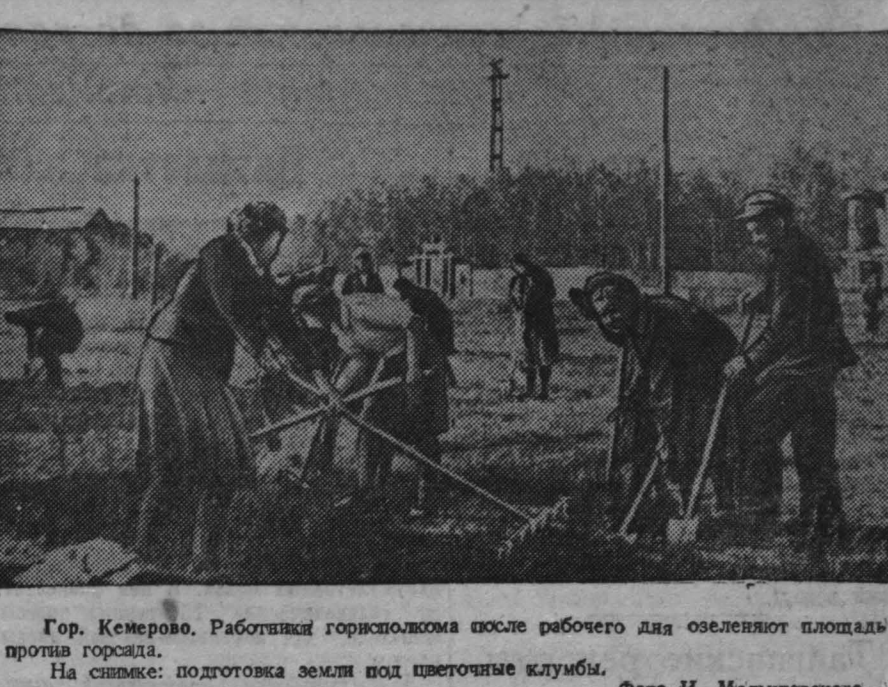
Гор. Кемерово. Работники горисполкома после рабочего дня озеленят площадь перед городом. На снимке: подготовка земли под цветочные клумбы.

Заключительная часть вчерашнего заседания была посвящена допросу Иудия зачинщиком Кетейла адвокатом Нельте. Ввиду позднего времени остальная часть его допроса переносится на следующий день.