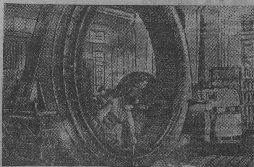
Донецкий электромеханический завод имени Маркса в г. Первомайске, Ворошиловградской области, выпускает электросборочное оборудование для шахт.