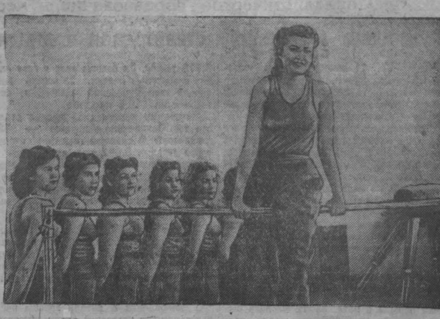
В гимнастическом зале Сибирского металлургического института г. Сталинка. На снимке: занятия на турнике.

Нельзя полагать, что в условиях крупного советского сельского хозяйства лисица одна в состоянии справиться с задачей истребления вредителей. Следуя этой точке зрения, органы Наркомзема, обязанные вести борьбу с вредителями полей, могут спокойно почитать на зарках, сжигаемых за них лисцей. Кстати сказать, во многих местах так и бывает. Лисица всегда является злейшим врагом охотничьего хозяйства, конкурируя с волком в массовом уничтожении охотничьих птиц и мелких промысловых зверей. Не случайно огромное сокращение запасов зайца-беляка в нашей области совпадает с необычайно распространением лисы. То массовое распространение лисы в Кемеровской области, которое мы наблюдаем, начиная с 1943 года, при-