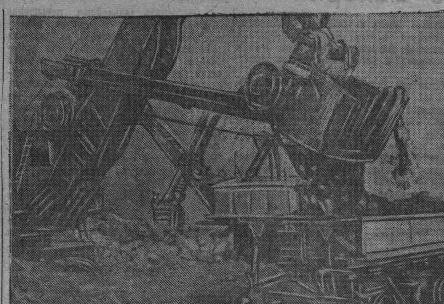
На горе Высокой — одной из крупнейших и передовых железнодорожных баз Урала. Механизированная добыча руды.

Государственное издательство художественной литературы возобновило издание ежемесячного литературно-художественного журнала «Роман-газета». Уже вышли в свет первые три номера, в которых помещены роман Фадеева «Молодая гвардия».