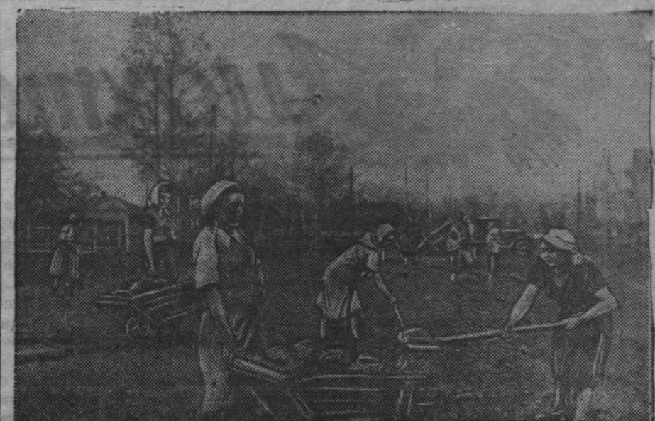
гор. Кемерово. Седьмой участок строительного треста производит подготовку к асфальтированию улицы Кузбассею.

В саду работают: читальный зал, тир, физкультурка (городки, мегли, крокет, волейбол), кино. Скоро открываются чайная-столовая и бильярдная. Начало гулянья с 7 час. вечера, танцев — с 9 час. вечера. Касса открыта с 6 час. 30 мин. вечера. Дирекция.