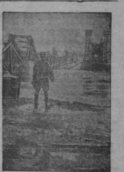
Возвращенный гитлеровцами мост через Вислу в г. Даршау.

Отел отремонтирован и подготовлен к эксплуатации на 62 часа раньше срока.