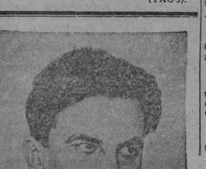
В. В. МАЯКОВСКИЙ

В работе ученого совета приняли участие многочисленные представители научно-литературной общественности столицы, сотрудники музеев, библиотек, студенты.