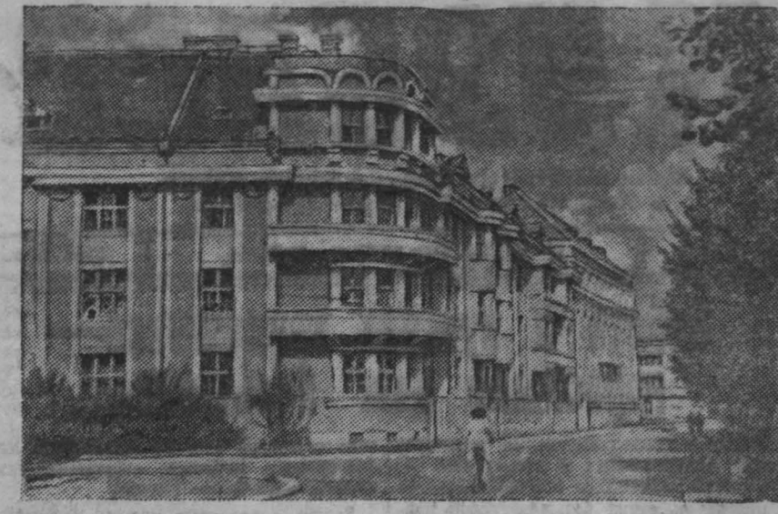
Закарпатская Украина. Угол Сталинградской набережной в Ужгороде. (Фотохроника ТАСС).

Характерна советский патриотизм, возлюбил Сталин отмечал, что в советском патриотизме гармонически сочетаются национальные традиции народов и общие жизненные интересы всех трудящихся Советского Союза.